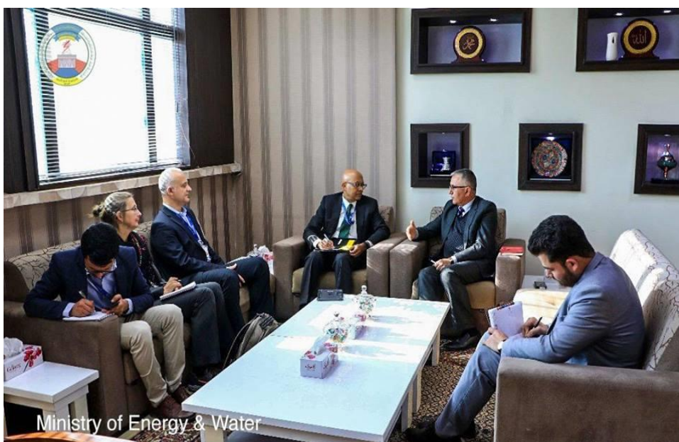
Ministry of Energy &amp; Water