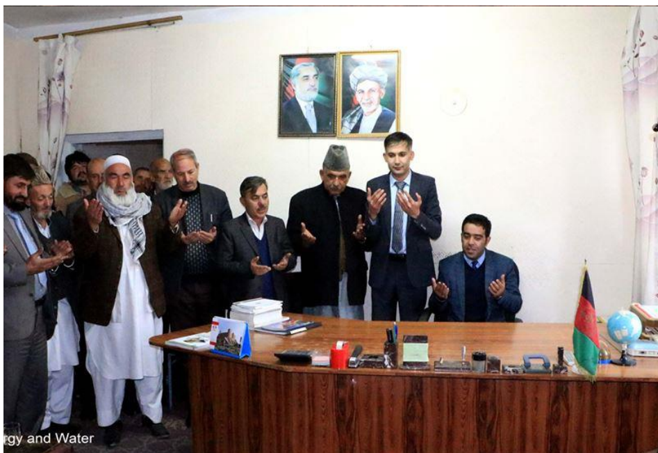
Ministry of Energy and Water

به اساس حکم شماره ۱۶۹۸ مقام عالی ریاست جمهوری کشور محترم محمد آصف غفوری سرپرست ریاست تصدی ساختمانی هلمند تعیین و توسط محترم انجنیر خان محمد تکل معین آب وزارت انرژی و آب به همکاران معرفی شد.