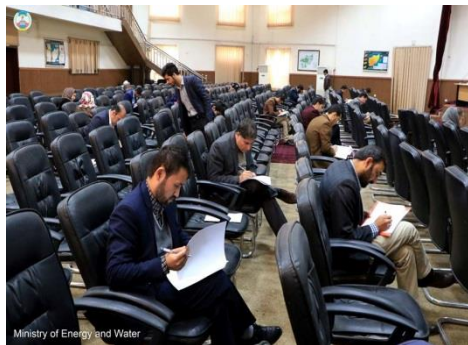
Ministry of Energy and Water