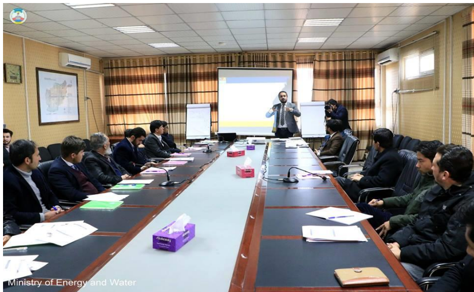
Ministry of Energy and Water

این برنامه به هدف آموزش چگونگی تهیه پلان تدارکاتی سالانه برای کارمندان بخش تدارکات و شماری دیگر از کارمندان وزارت انرژی و آب دایر شد. در این برنامه موضوعات زیر به اشتراک کننده ها آموزش داده شد. اهمیت پلانگذاری تدارکات در تطبیق موفقانه پروسه تدارکاتی، انتخاب روش مناسب در پلان تدارکاتی، دانستن نقش جناح های ذینفع در ترتیب پلان تدارکاتی، ترتیب پلان تدارکاتی با استفاده از فورم استندرد پلان اداره تدارکات ملی، پلانگذاری و اهمیت آن در تدارکات، فواید پلانگذاری تدارکات، برآورده شدن اهداف مشخص اداره، محتویات پلان تدارکاتی، مراحل سه گانه تدارکاتی، بودجه و اهمیت آن در تدارکات، مدیریت خطر در مرحله پلانگذاری تدارکاتی، پروسه مدیریت خطرات و همچنان در مورد سیستم مدیریت پلان تدارکات افغانستان (APPMS).