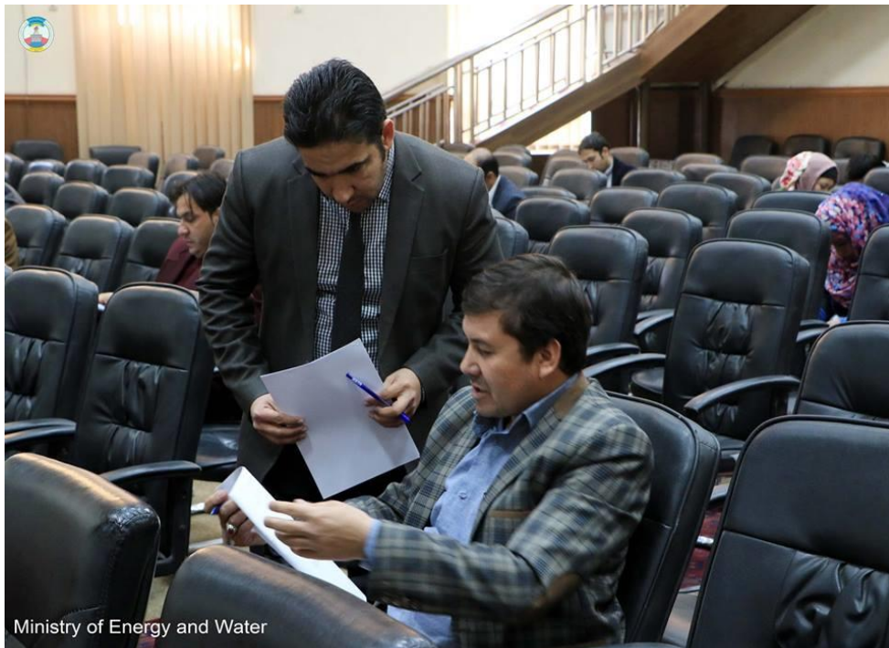
Ministry of Energy and Water